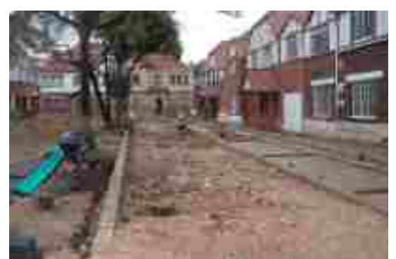
Desarrollo de las Obras