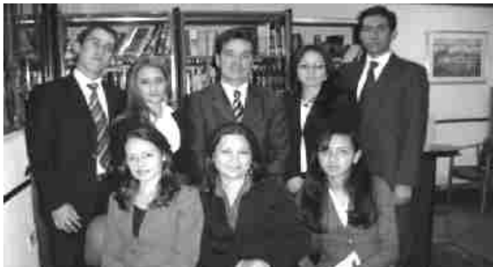
El Grupo Unipanamericano de Investigación Contable tiene como objetivo principal hacer un análisis de los diferentes cambios sustanciales y procedimentales propuestos al Estatuto Tributario Nacional.

Se presenta el proyecto como una reforma estructural al sistema tributario Colombiano su fundamento jurídico está sustentado en los principios de simplicidad (vuelco estructural al estatuto tributario), equidad (defensa de la equidad vertical y horizontal), competitividad (promover crecimiento y empleo formal) y estabilidad (defender la sostenibilidad fiscal y lograr un mayor grado de inversión).